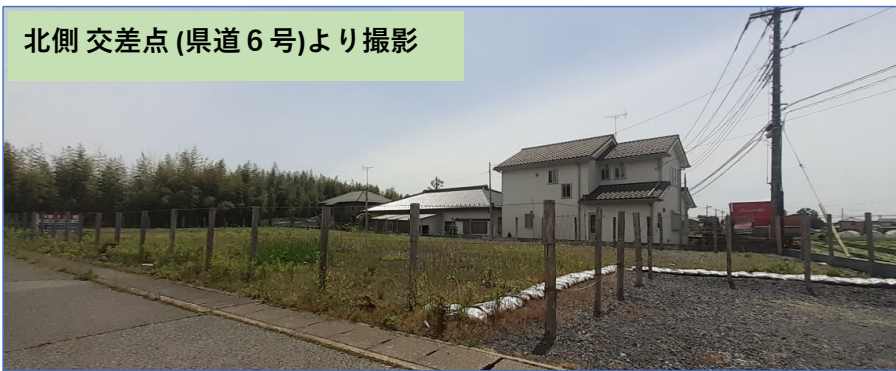
北側 交差点 (県道 6 号)より撮影